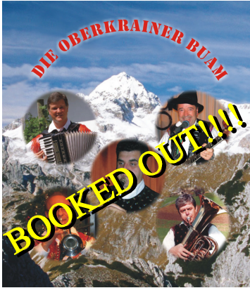
Die Oberkrainger Buam

Don't forget to get dressed in "Trachten" for these amazing Nights!